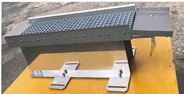
ZUKA 振動選別機 ST600200 (本体)

収穫した野菜に混入しているゴミ（昆虫、土・砂、屑葉）を除去することができます。運転ノイズが低いので作業中の不快感が有りません。選別能力は大型機に引けを取りません。コンパクトで場所も取らず設置が楽です。移動も簡単です。