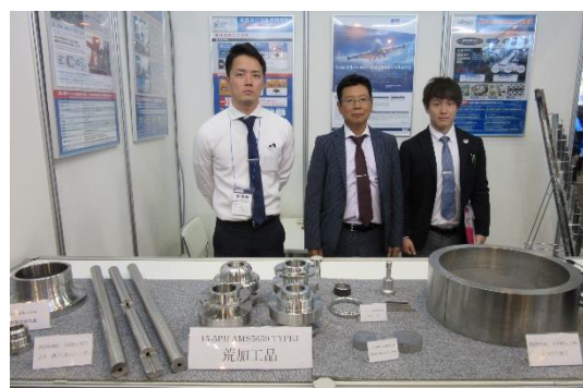
図表③ 出展企業、阪神メタリックスの展示