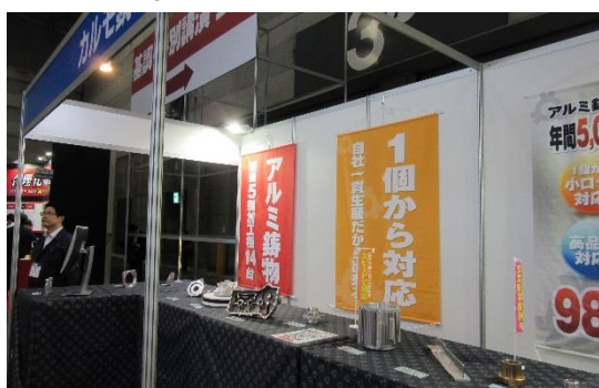
図表② 出展企業、カルモ鑄工の展示

このうち、今後、航空機産業への本格参入を目指して活動する団体の展示として、安来市を中心とした島根県内の7社によって活動してい